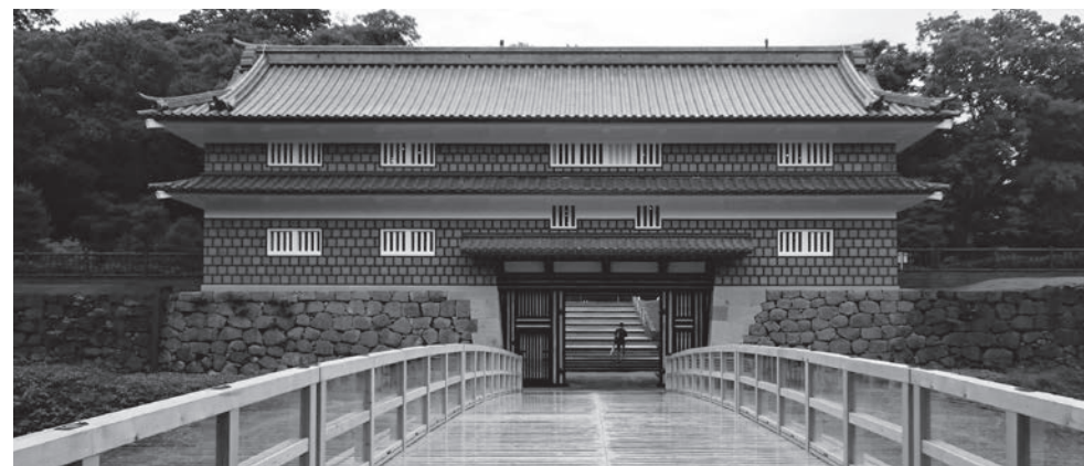
鼠多門・鼠多門橋

秋涼の季節となりました。皆様には益々ご清祥のこととお慶び申し上げます。日頃よりPTA活動にご理解、ご協力を賜り、心よりお礼申し上げます。