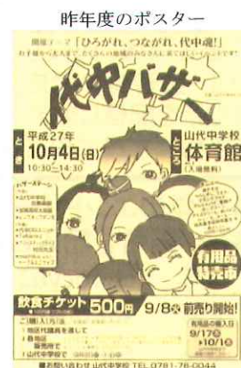
絵は本校美術部生徒の作品