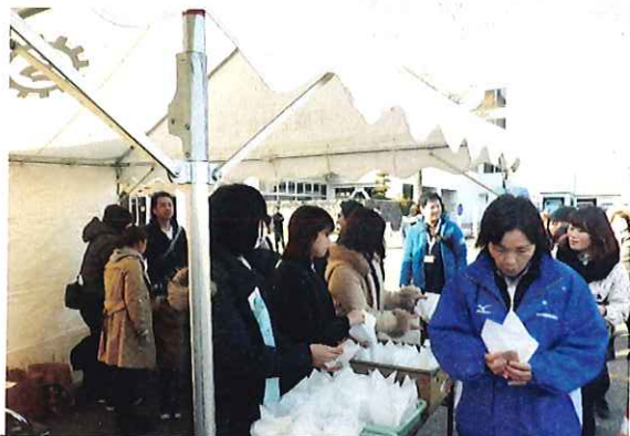
尚絅学院大学の学生さん達提供のカレーパンは、 ホクホクで大人気。こちらも長い列ができました。