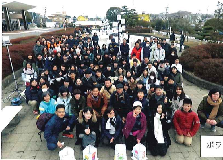
ボランティアの皆様