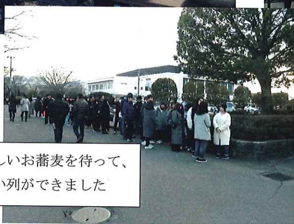
美味しいお蕎麦を待って、 すごい列ができました