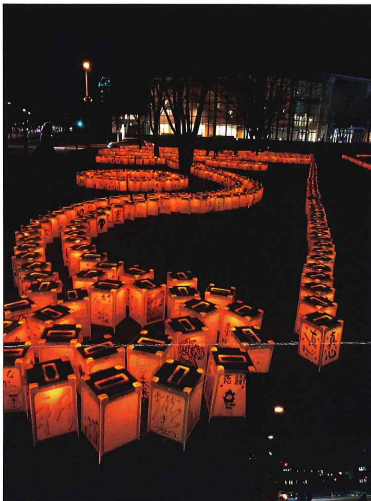
名取市体育館外庭の様子