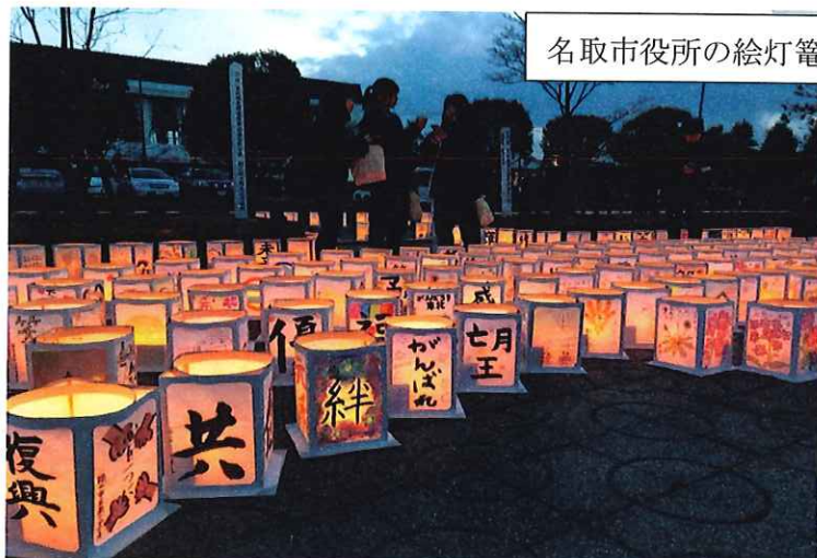
名取市役所の絵灯籠の様子