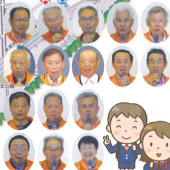
パトロール隊の人たち

「いか」⇒行かない 「の」⇒乗らない 「お」⇒大声でさけぶ 「す」⇒すぐにげる 「し」⇒知らせる