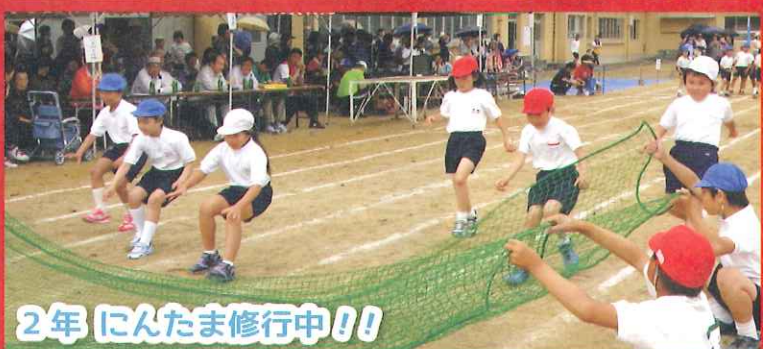
2年 にんたま修行中!!