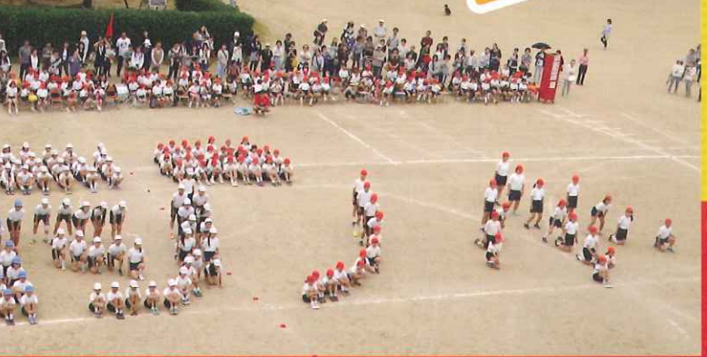
3・4年 じょんからソーランキッズ2016