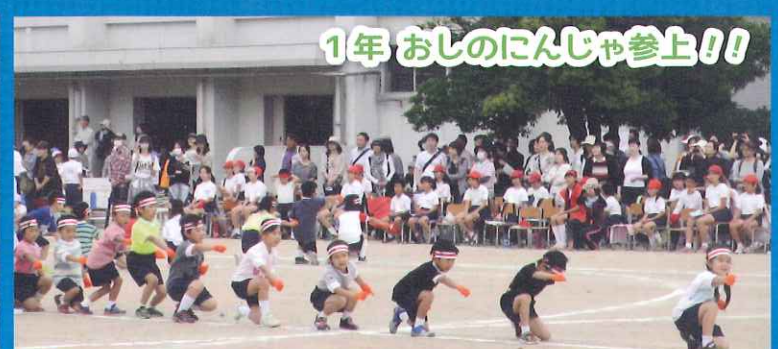
1年 おしのにんじゃ参上!!