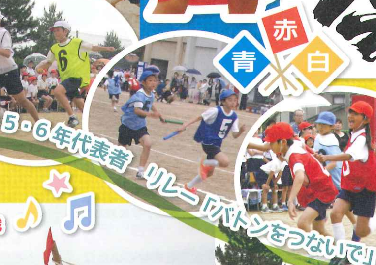
3・4・5・6年代表者 リレーバトンをつないで!