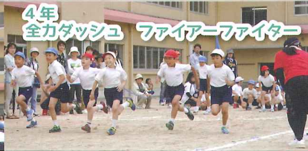
4年 全カダッシュ ファイアーファイター