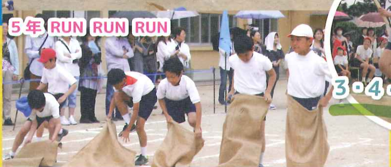
5年 RUN RUN RUN