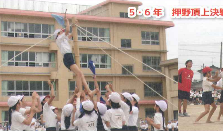
5・6年 押野頂上決戦