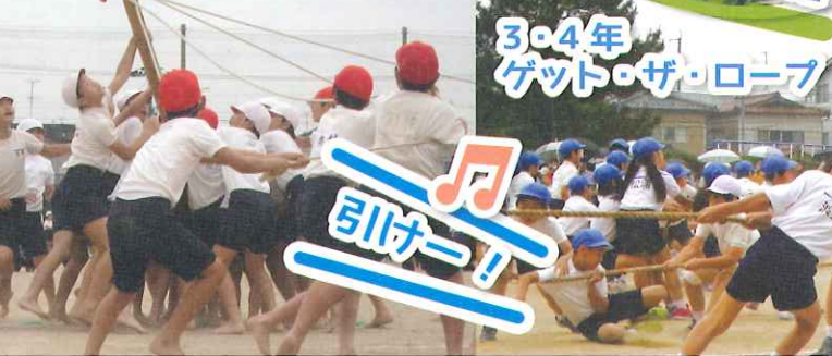
3・4年 ゲット・ザ・ロープ