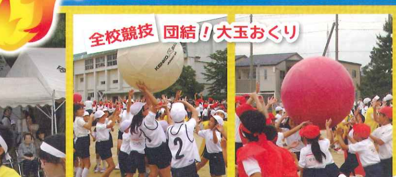
全校競技 団結! 大玉おくり