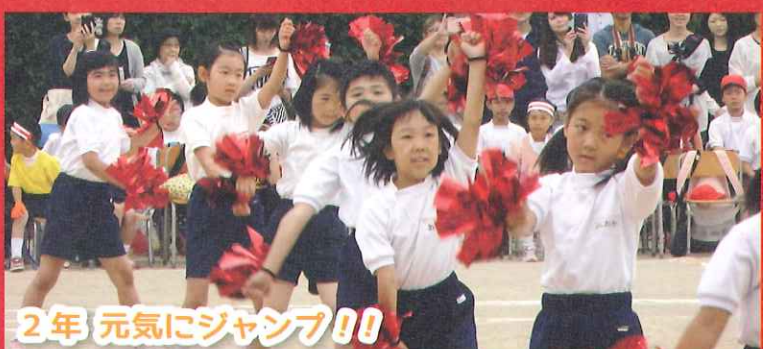
2年 元気にジャンプ!!