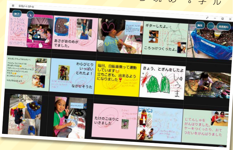
▲「臨時休業中にチャレンジしたこと」1年生の回答

校が再開してから様々な場面面でICT機器を有効に活用しながら学習を進めています。ICT活用の主な利点は、写真や動画を