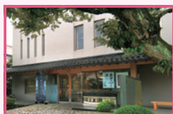
金沢ふるさと偉人館