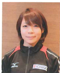
三宅 宏実氏 Hiromi Miyake

ウエイトリフティング選手 ロンドンオリンピック48kg級銅メダル リオデジャネイロオリンピック48kg級銅メダル